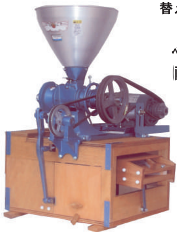
木製フルイ箱 ※写真のタンクは、旧タイプとなります

ベルトカバー付 (画像はモーター付で、見えやすいようにベルトカバーを外しております。)